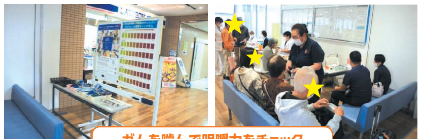
ガムを噛んで咀嚼力をチェック