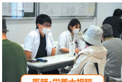
医師・栄養士相談

当院では、ダイアベティスデーに合わせて院内でイベントを開催し、約60名の方が来場されました。来場者には、ガムを噛んでもらい咀嚼力を測定し、血糖測定をしてもらいました。また医師・管理栄養士による相談ブースを設置しました。